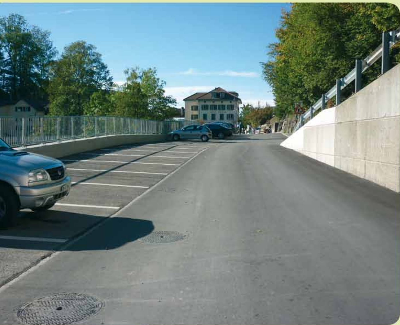
Die neue Parkierungsanlage Sihlwäldliweg, Schindellegi