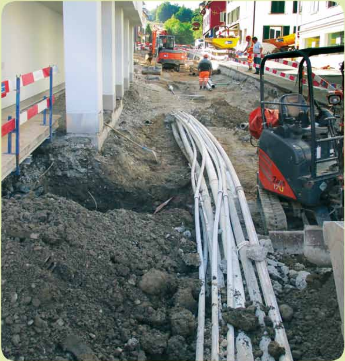
Sanierungsarbeiten an der Dorfstrasse in Schindellegi

Gemeindeversammlung Freitag, 11. Dezember 2015, 20.00 Uhr im Maihofsaal in Schindellegi