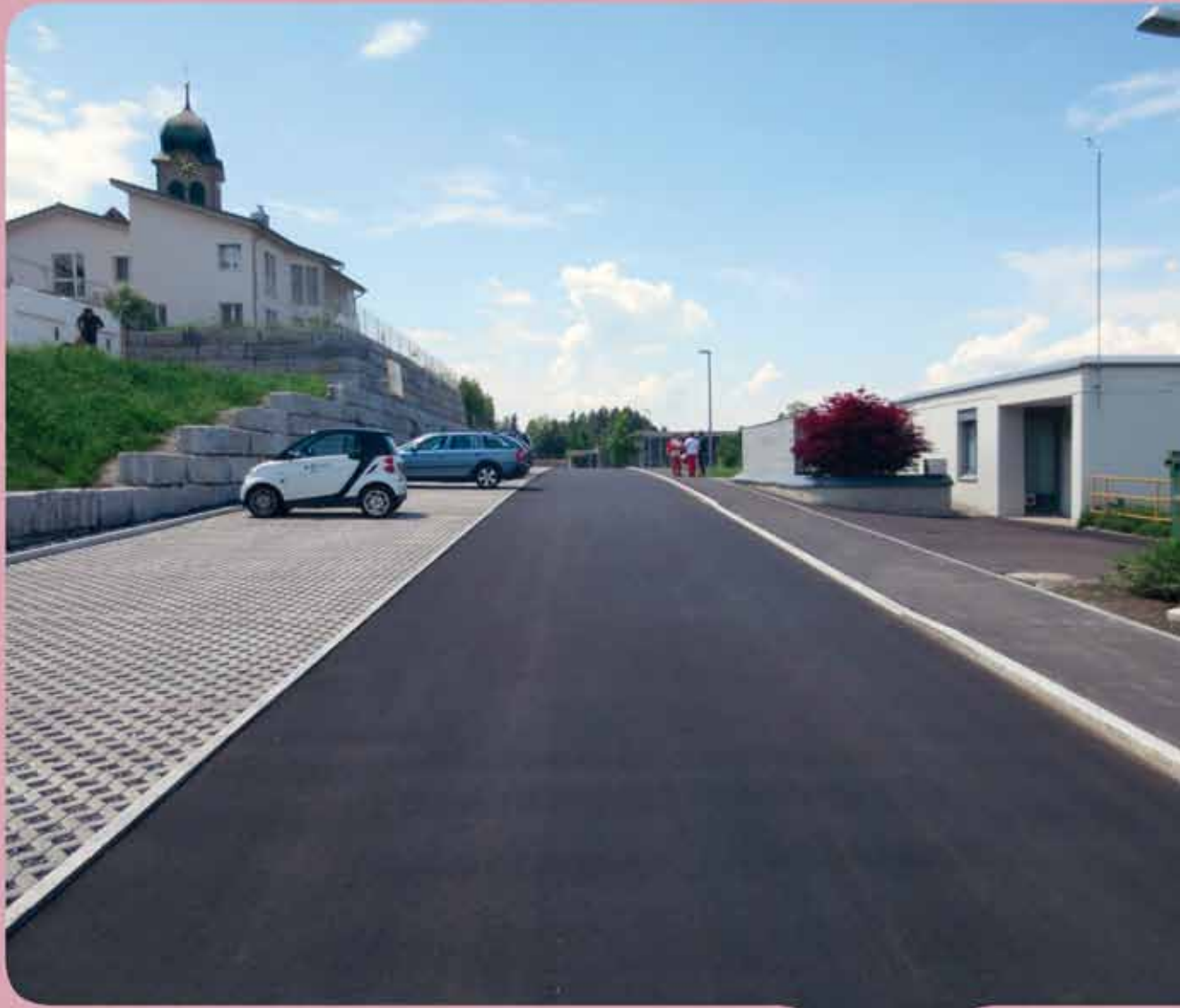
Parkierungsanlage Schulhausstrasse Feusisberg

Gemeindeversammlung Freitag, 24. April 2015, 20.00 Uhr im Maihofsaal in Schindellegi