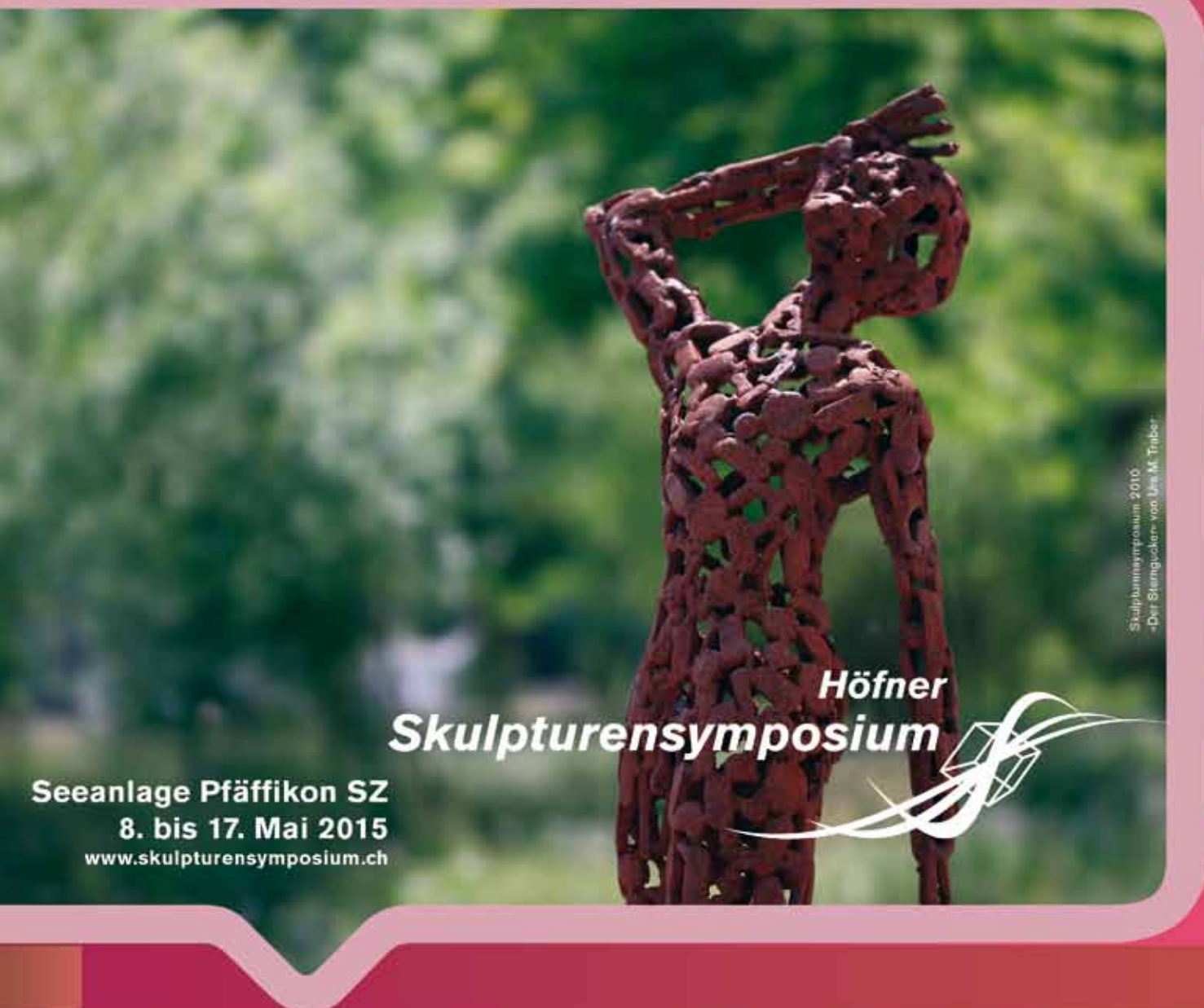
Skulpturensymposium 2010 -Der Stengelskelen- von Uta M. Traber-